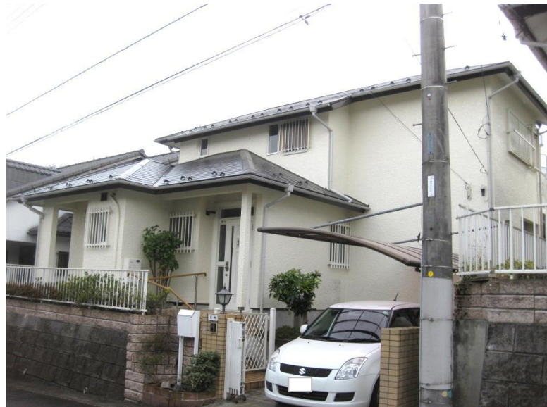
区画の整った閑静な住宅街